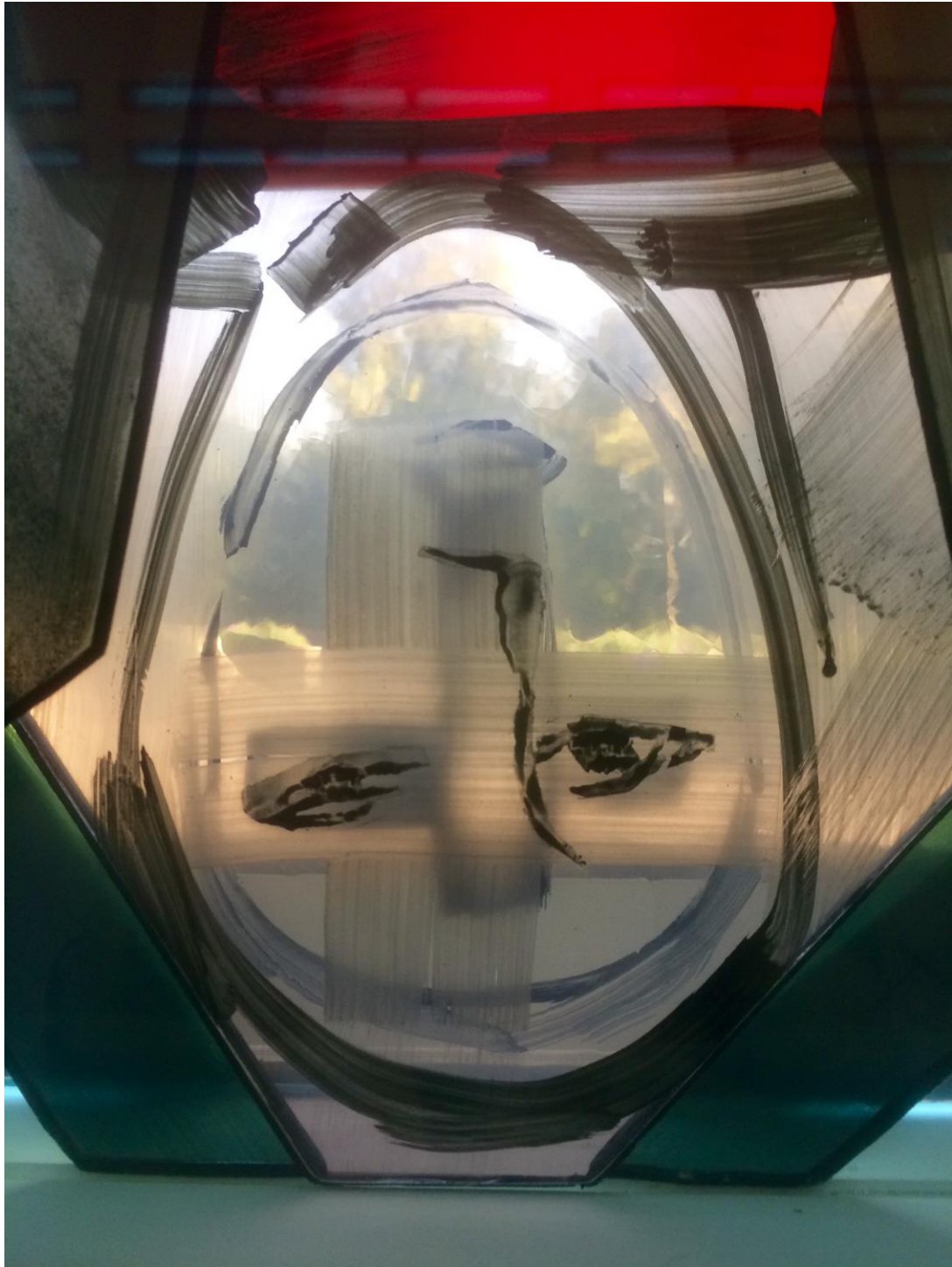
Detail uit het raam in de kapel in het Landelijk Dienstencentrum van de PKN, gemaakt door Ann Wolff

Informatieblad van de oud-katholieke parochie Amersfoort